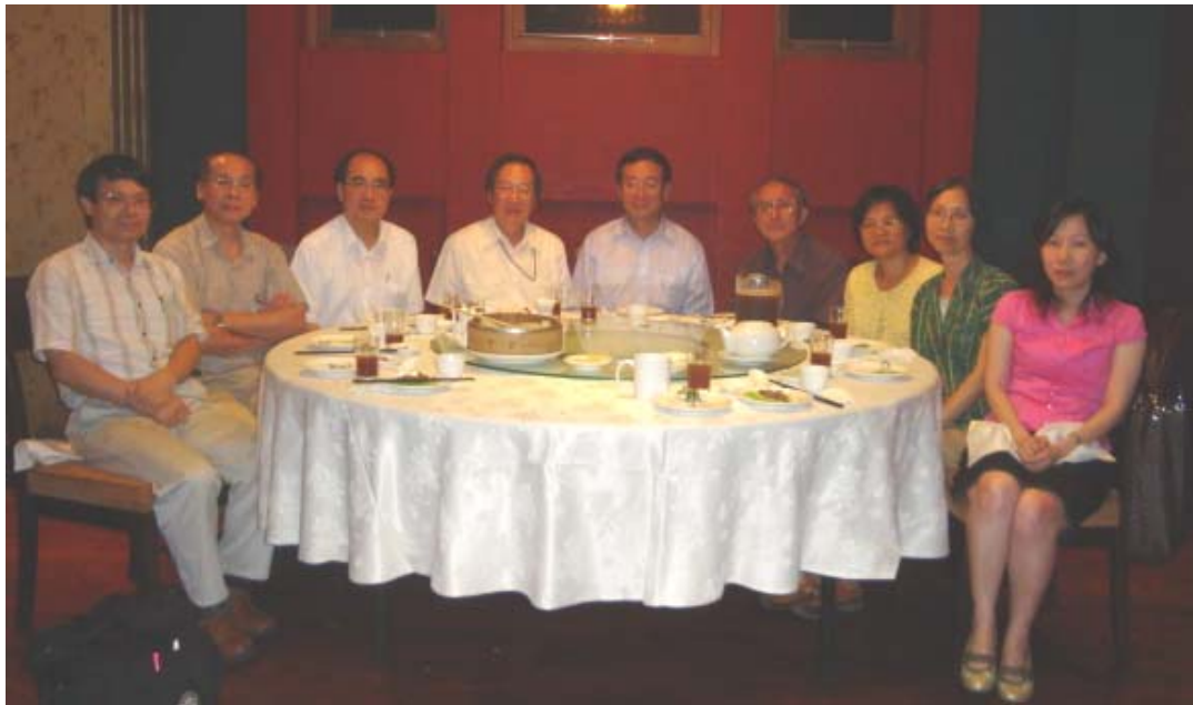
李理事長與理監事合影