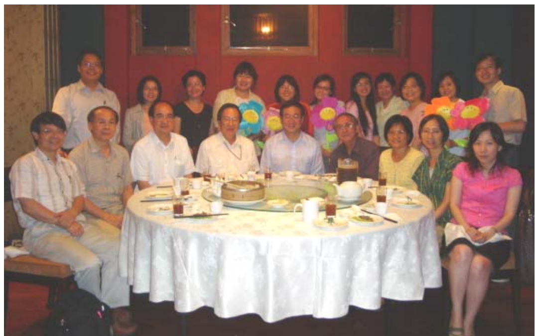
全體幹部與理監事合影